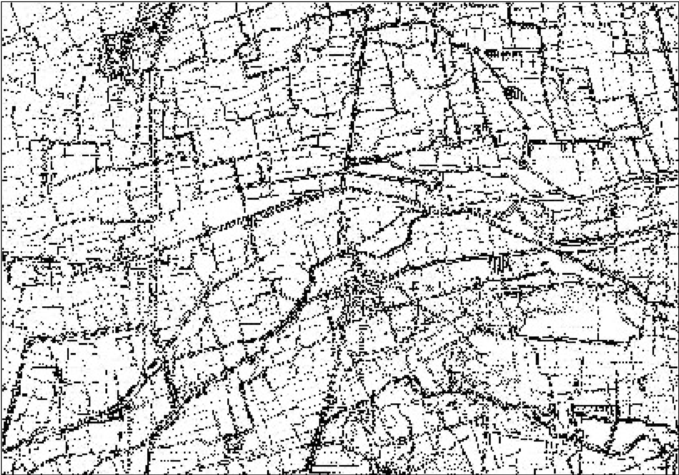
LEVATA DEL 1889