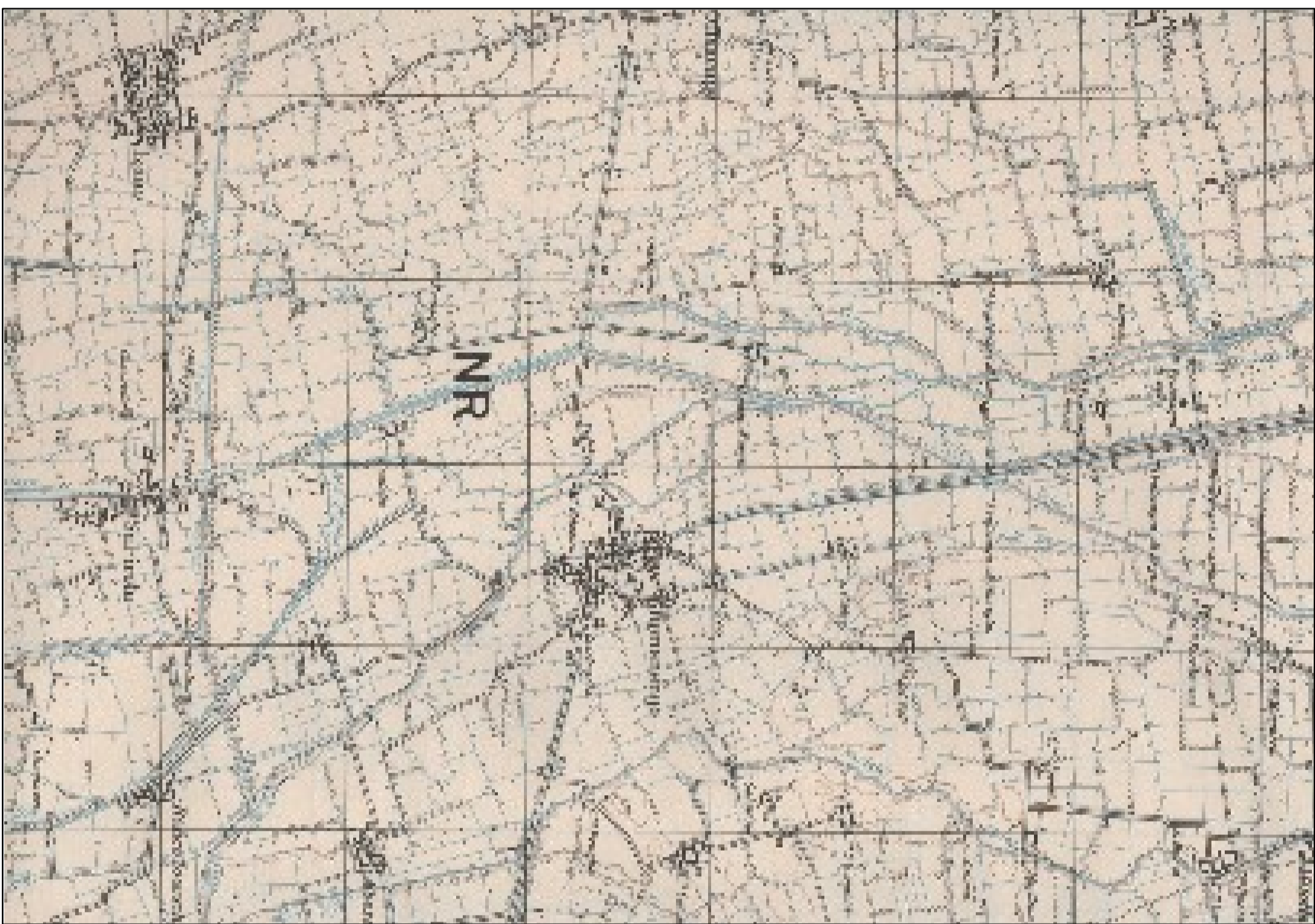
LEVATA DEL 1955